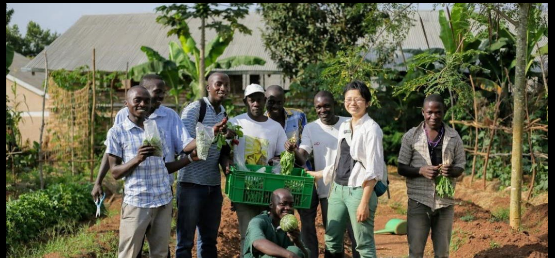
ウガンダ人の調理、サービス、農業人材を育成