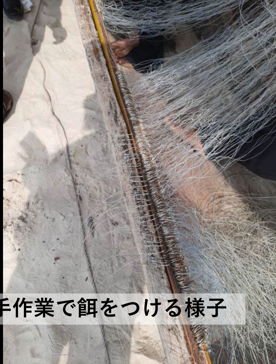
夜の漁に備え、数百本の針に手作業で餌をつける様子