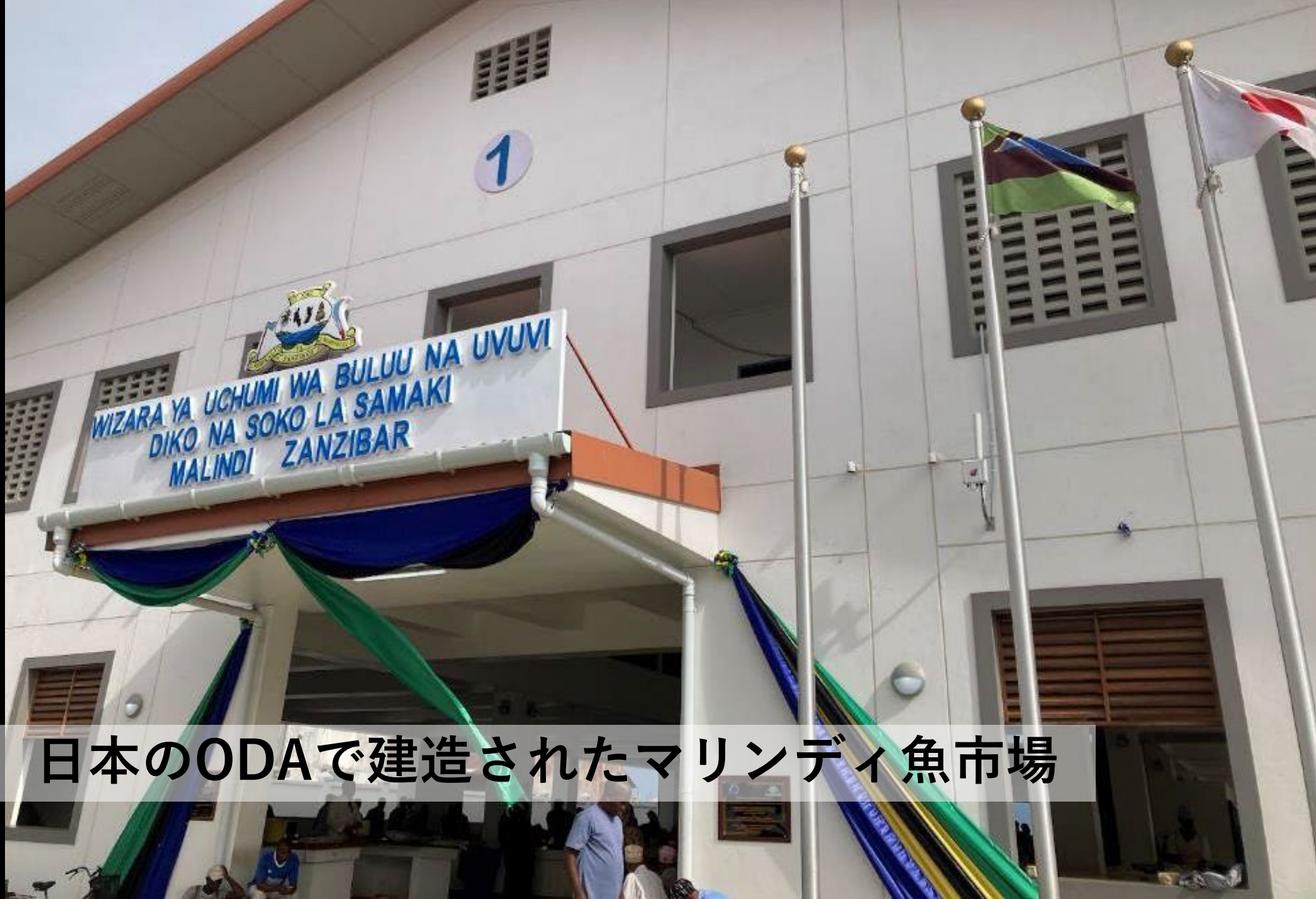
日本のODAで建造されたマリンディ魚市場